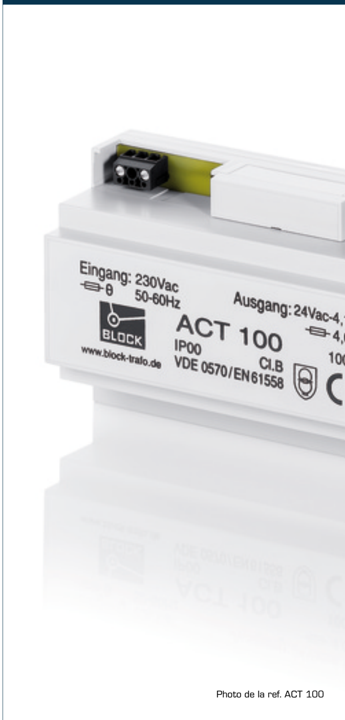
Photo de la ref. ACT 100