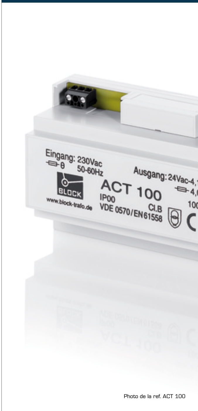
Photo de la ref. ACT 100